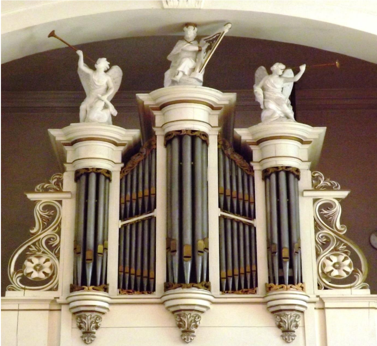
Knipscheer Orgel (Rijksmonument)

Het orgel werd in 1867 geleverd door de Gebr. Knipscheer uit Amsterdam. Het was een “tweedehands” orgel. Er werden bestaande balgen en overwegend bestaande pijpen gebruikt. Een deel van de pijpen stamt uit de 17 e eeuw. Het orgel werd in 1923 gewijzigd. In 1985 vond een grote orgelrestauratie plaats. Een groot aantal pijpen werd vervangen en het orgel werd in de oorspronkelijke staat, zoals het door de Gebr. Knipscheer was gebouwd in 1867, teruggebracht. De blaasbalgen werden van de zolder naar het orgelbalkon verplaatst. Op 18 mei 1985 werd het orgel opnieuw in gebruik genomen. In 1994 is dit orgel op de Rijksmonumentenlijst geplaatst.