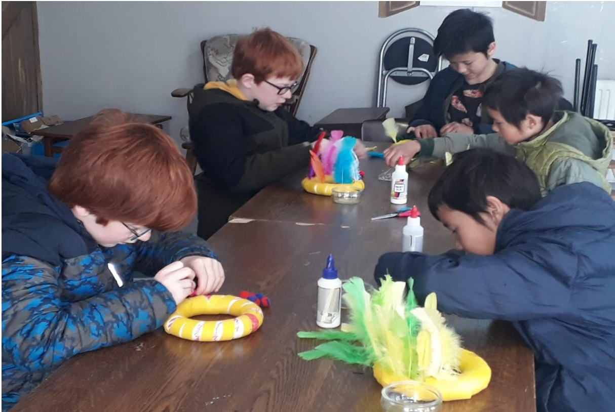
Kindernevendienst activiteit; Knutselen met een Bijbels thema

Er is op dit moment helaas geen jeugdouderling en dit wordt opgevangen door enkele enthousiaste gemeenteleden.