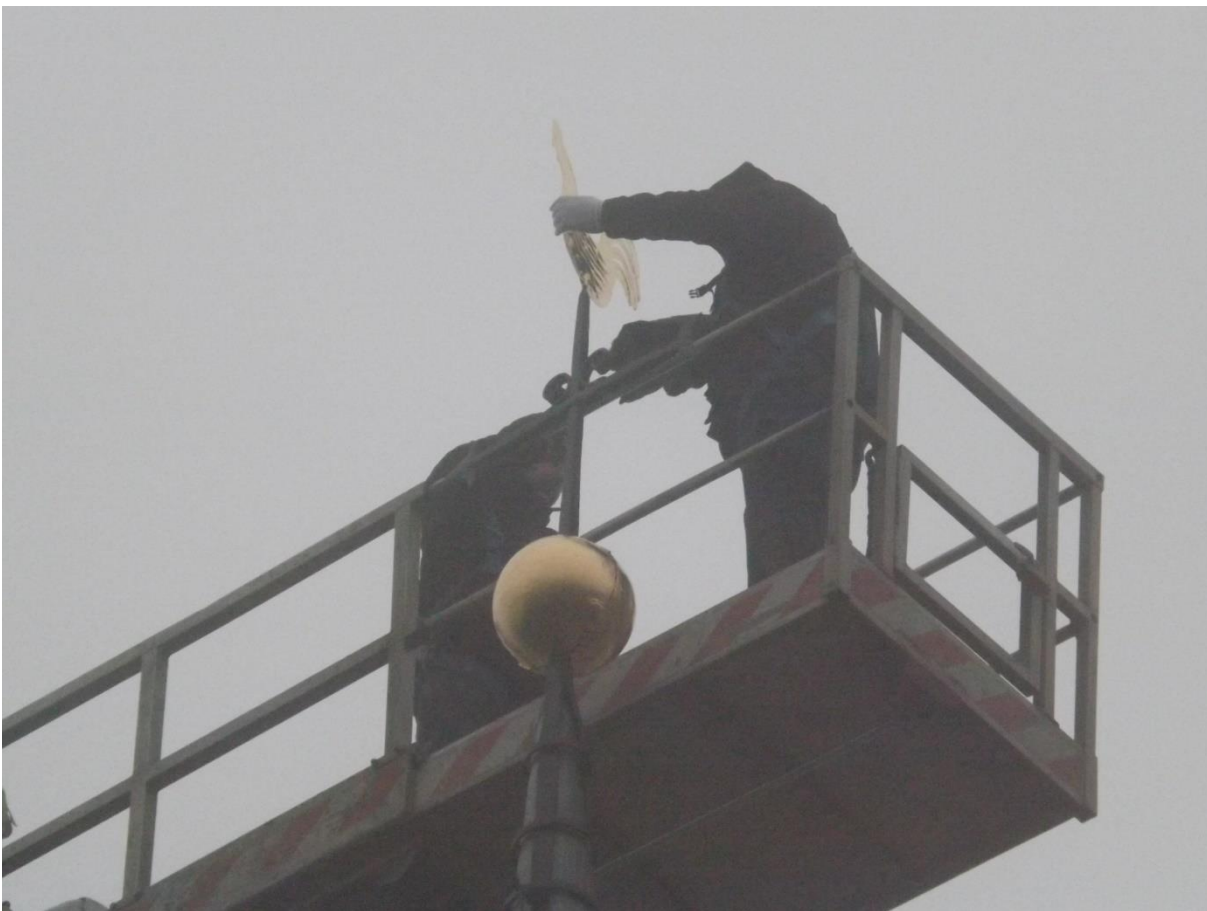
Terugplaatsen bol en haan (dec.2021) Restauratie op niveau!

Voor de kerk en zaal Withmundi is een onderhoudsplan opgesteld. Er is SIM (subsidie instandhouding monumenten) subsidie ter hoogte van €39.000 verleend. Tot en met april 2022 zijn het dak, kilgoten, toren, en het uurwerk grondig geïnspecteerd en gerestaureerd.