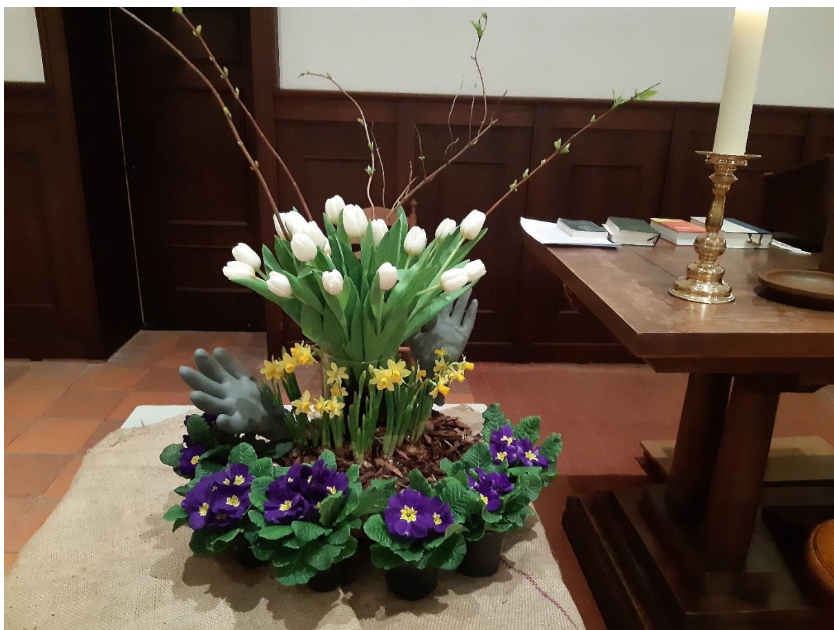
Liturgisch bloemstuk bij de biddag voor gewas en arbeid 2020

De diaconie onderzoekt ook welke mogelijkheden er zijn om meer "diaconie voor het dorp" te zijn. Zo stelt de diaconie grond beschikbaar voor het flexwoningenproject. (Zie 1A Kerk voor het Dorp)