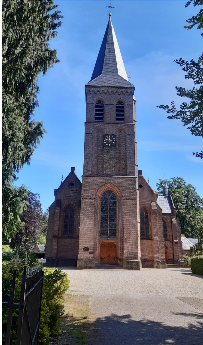
RK Sint Willibrorduskerk te Vierakker